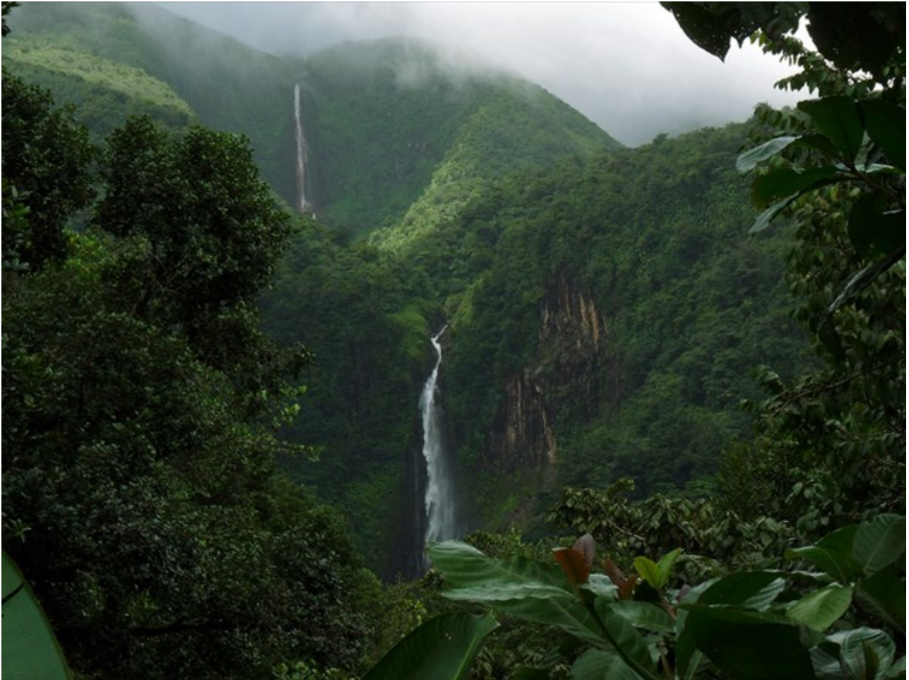
Les chutes du Carbet