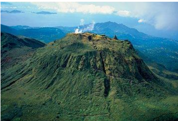
Vue aérienne de La Soufrière