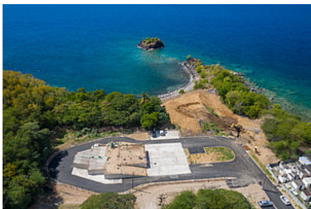
La Déchetterie de Bouillante

Pour la sécurité de tous, il est important que les consignes de sécurité soient respectées et que le civisme soit de rigueur envers autrui.