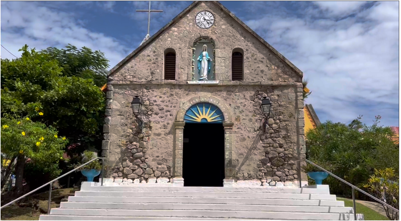
Eglise Notre-Dame-de-l'Assomption de Terre-de-Haut