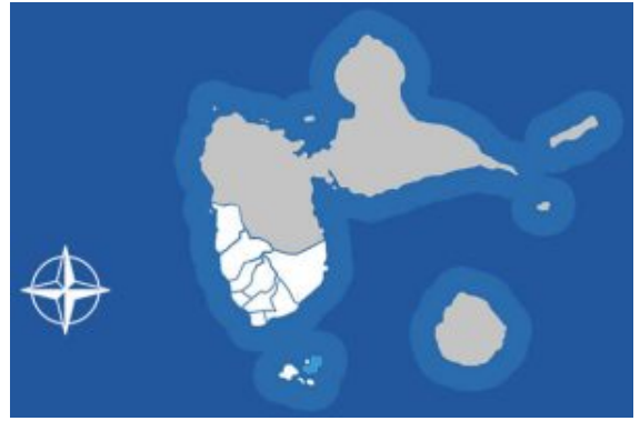
Situation de Terre de Haut