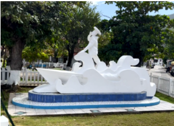
Statue du pêcheur