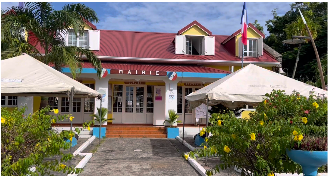
Hôtel de ville de Terre de Haut