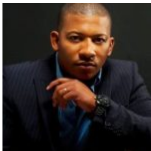
Jean-Philippe COURT0IS, Maire de Capesterre Belle-eau