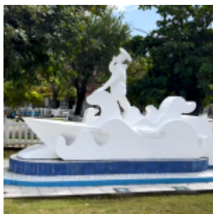
Statue du pêcheur