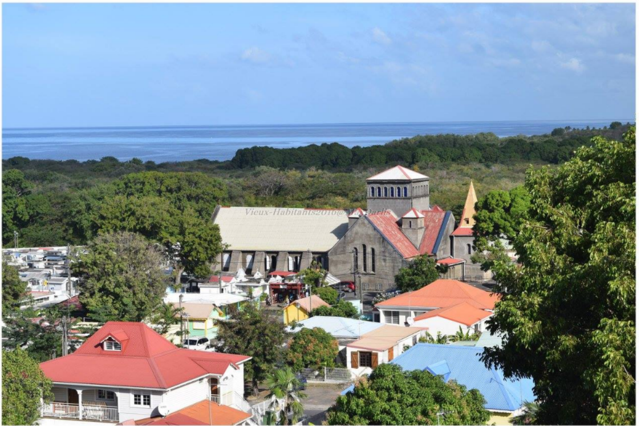
Ville de Vieux-Habitants