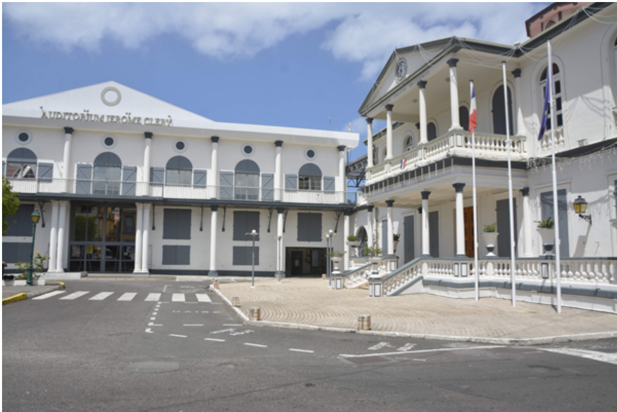
Hôtel de ville de Basse-Terre