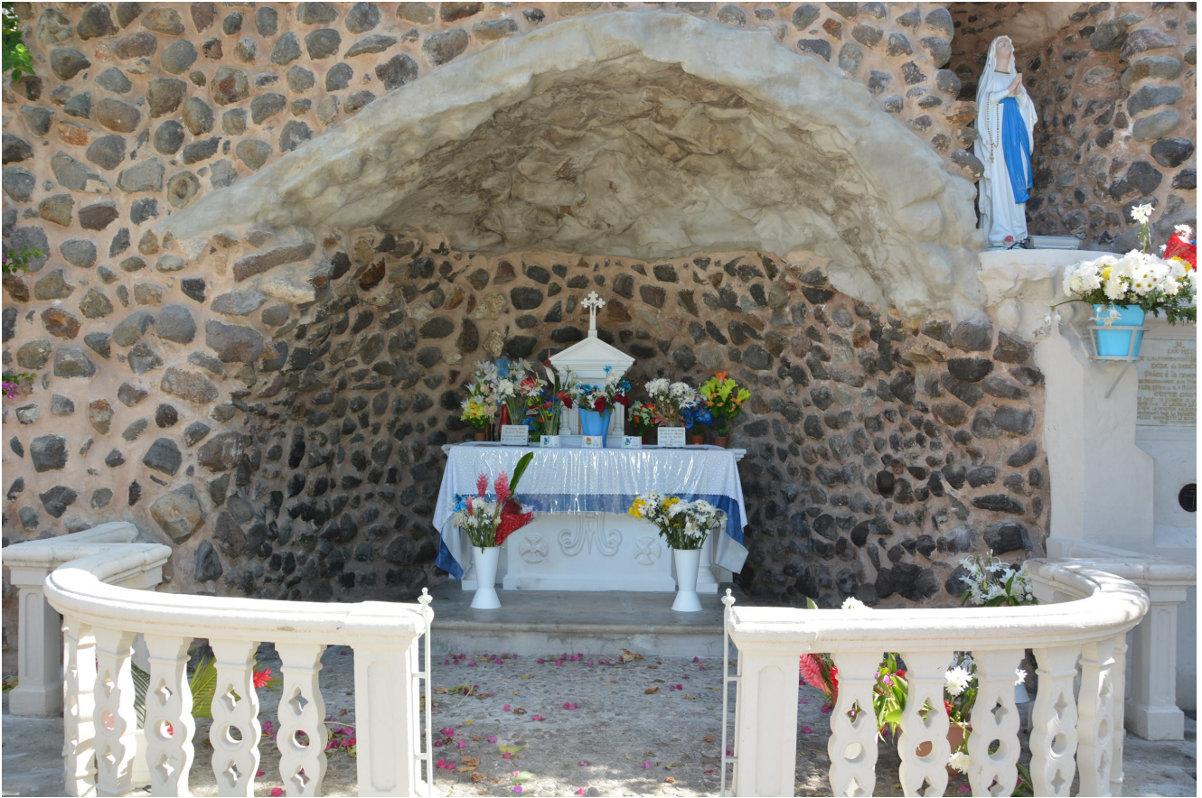
Notre-Dame du Mont Carmel à Basse-Terre