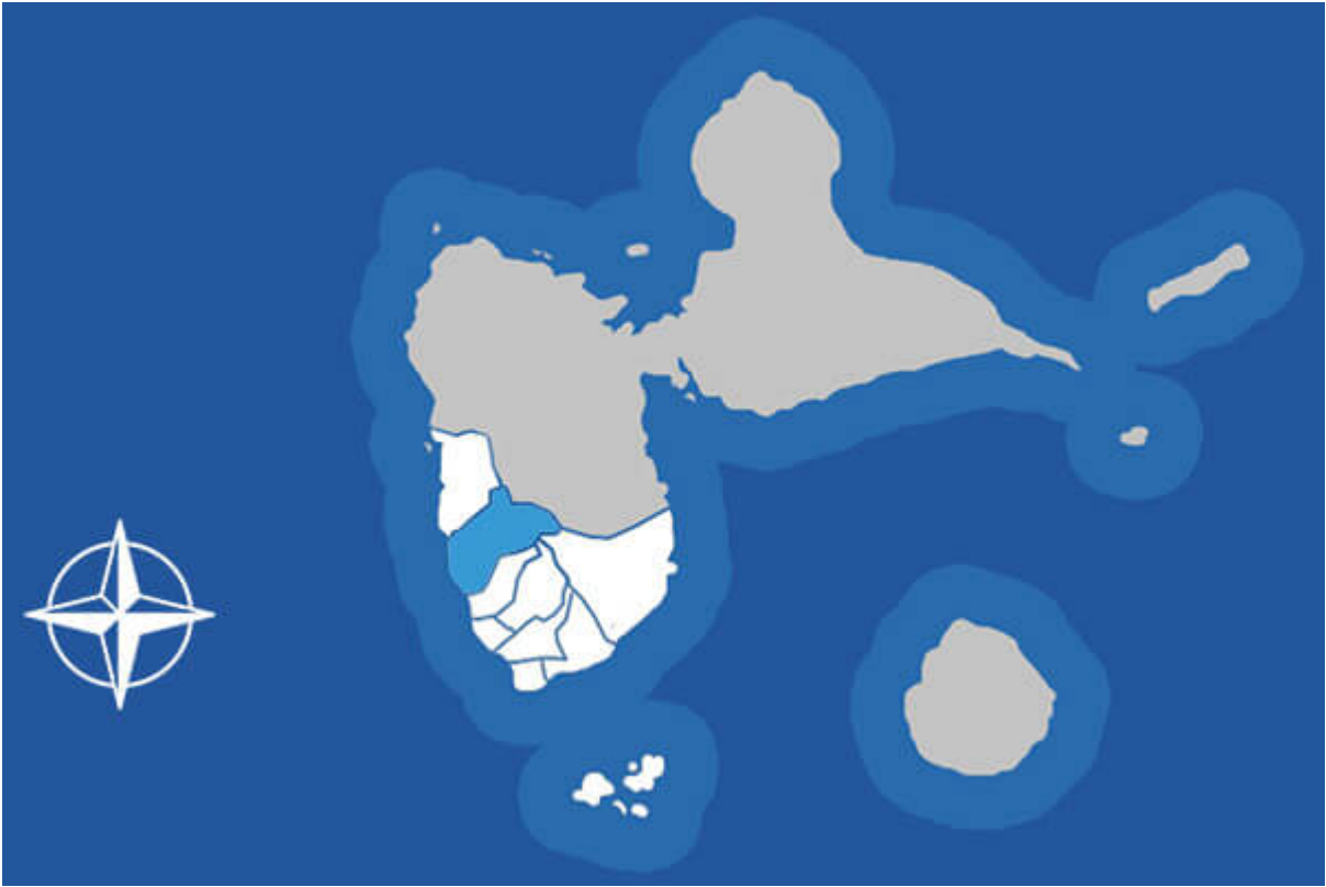
Situation de Vieux-Habitants