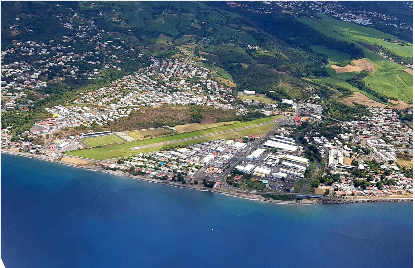
Vue aérienne Aéroport de Baillif