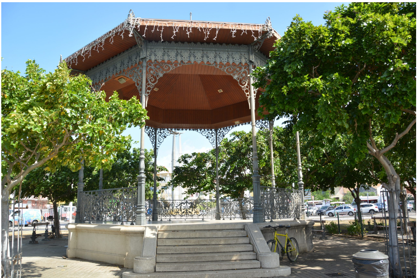
Kiosque à musique de Basse-Terre