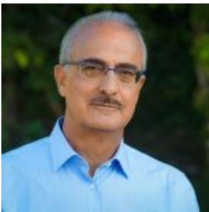
André ATALLAH, Maire de Basse-Terre