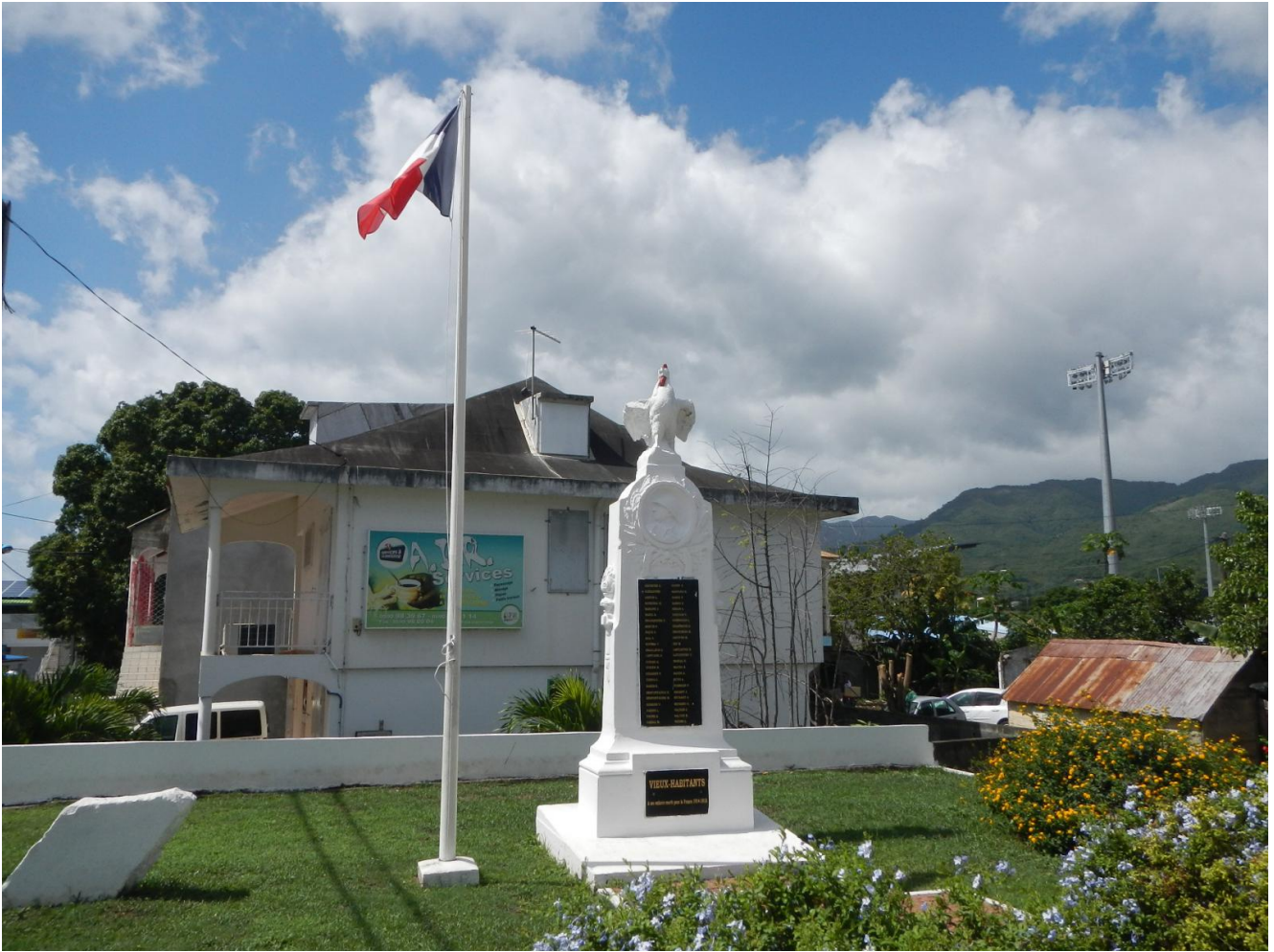
Monument aux morts de Vieux-Habitants