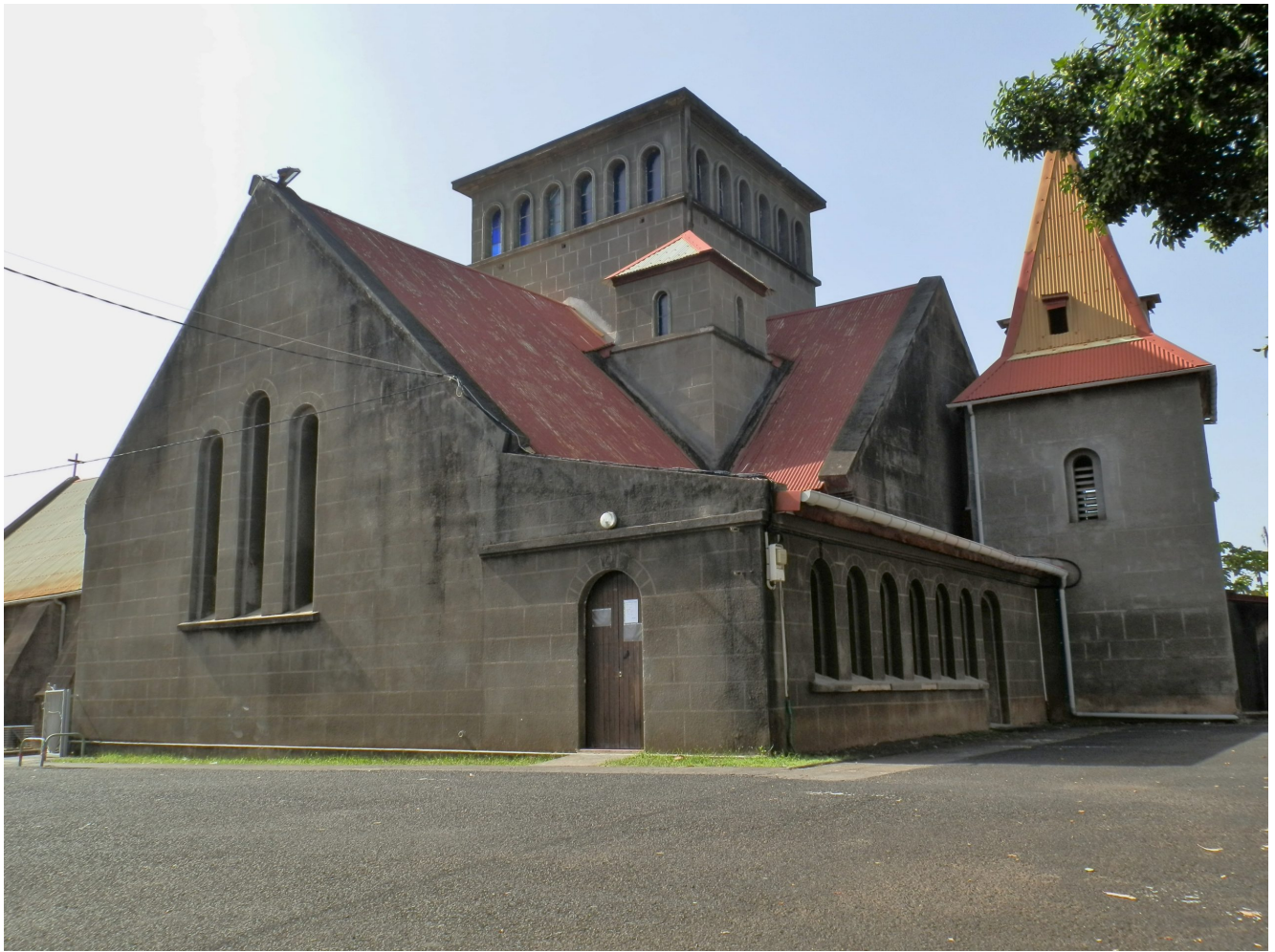
Eglise Saint-Joseph de Vieux-Habitants