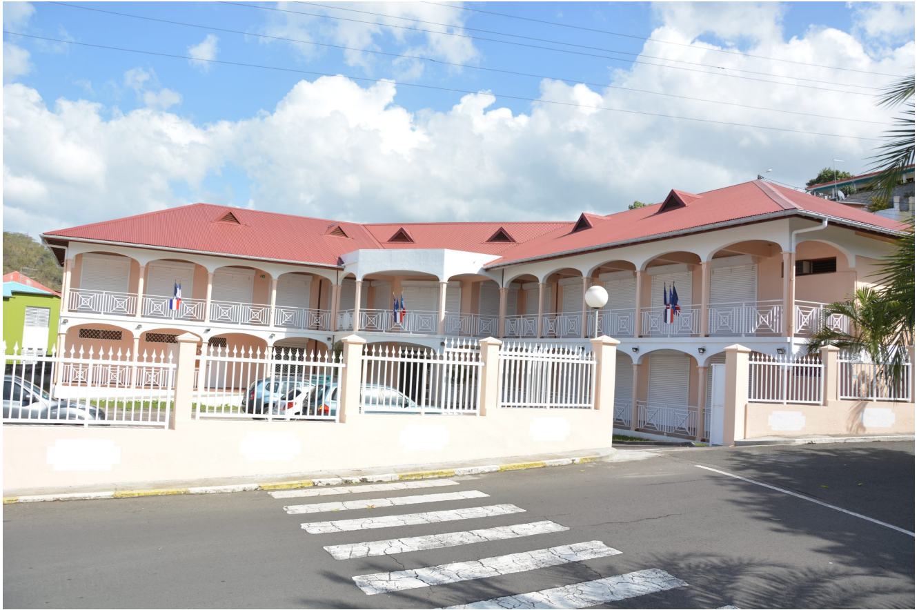
Hotel de ville de Baillif