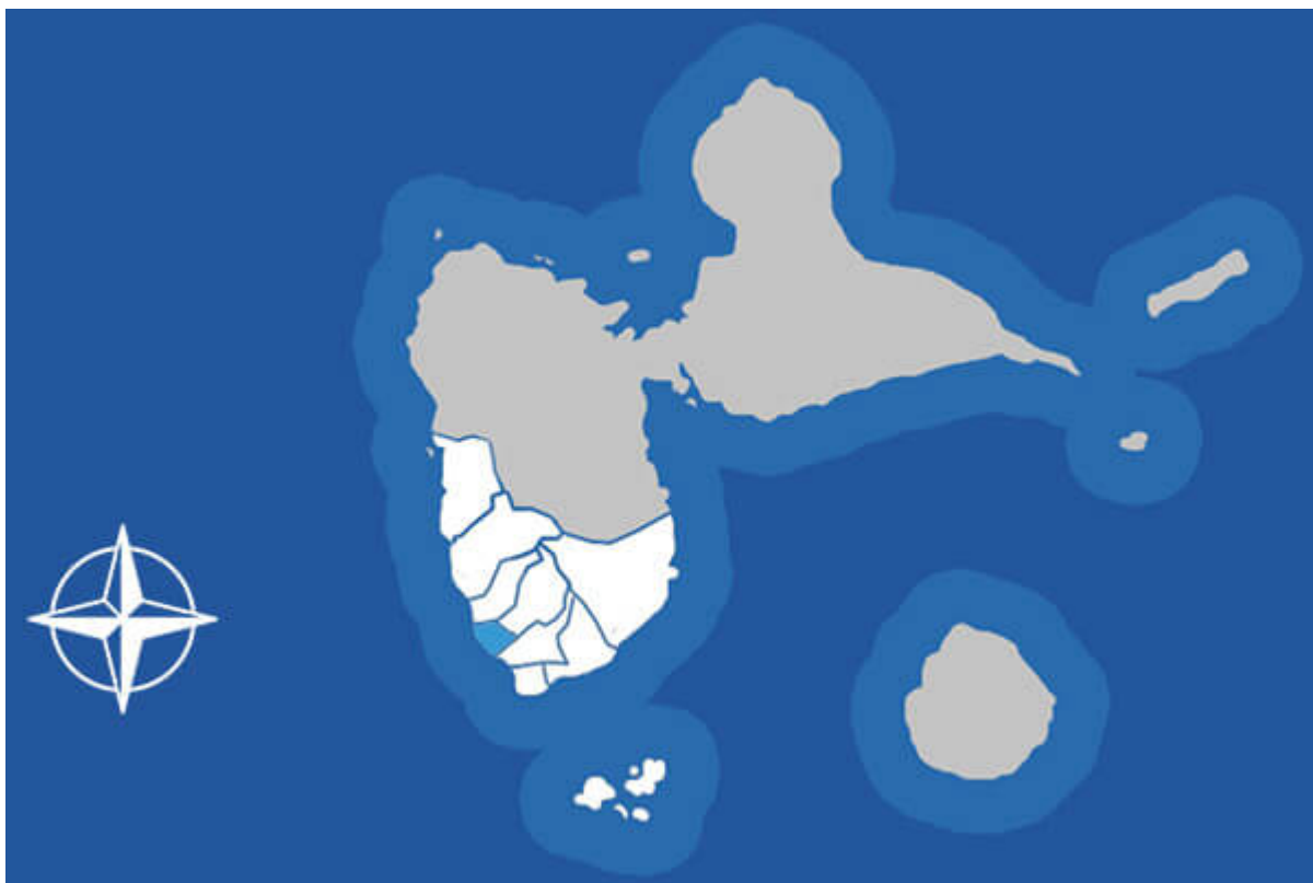
Situation de Basse-Terre