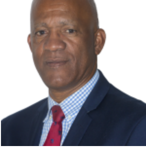
Jules OTTO, Maire de Vieux-Habitants