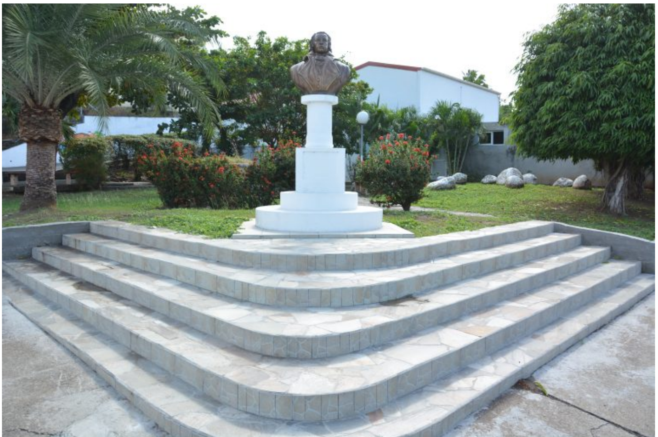
Buste de Louis Delgrès